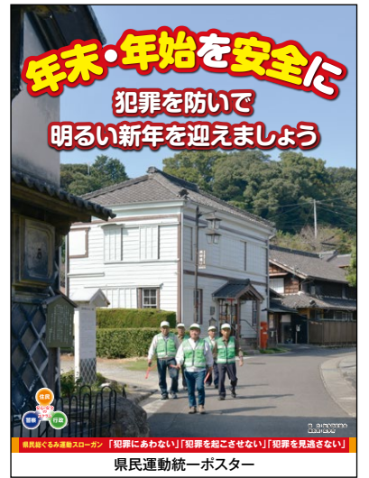
県民運動統一ポスター

この運動は、県民一人一人が防犯意識を高め、県民総ぐるみの安全なまちづくり活動として、犯罪を起こさせない環境作りに取り組むことにより、安全で安心して暮らせる社会の実現を目指すものです。