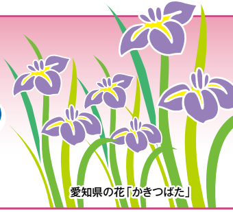
愛知県の花「かきつばた」

発行所：(公社)愛知県防犯協会連合会 名古屋市昭和区円上町26番15号 (愛知県高辻センター 2階) (052) 871-2110