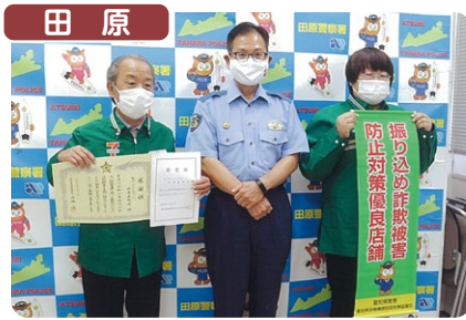
田原 特殊詐欺被害を阻止した店舗としてセブンイレブン田原本町店に署長感謝状と振り込め詐欺被害防止対策優良店舗の懸垂幕が贈呈されました。