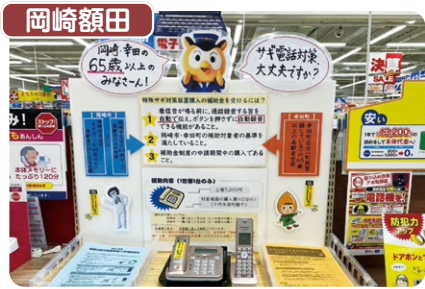
岡崎額田 岡崎額田防犯団体連絡協議会では、管内家電量販店の協力を得て「特殊詐欺対策電話特設コーナー」を設置、岡崎市・幸田町の補助金対象機種種の普及促進を図りました。