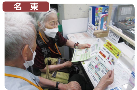
名東 名東署及び防犯協会連合会では、県内初の取組として、賛同企業の協力を得て、特殊詐欺被害撲滅のための防犯電話助成事業に取組み、区民に被害防止を呼びかけています。