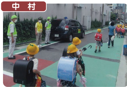
中村 則武学区防犯協議会では青パトの増車に伴い、中村警察署長、区役所区政部長を来賓に迎え出発式を行った後、ほか小学校低学年の下校時見守り活動等を実施しました。