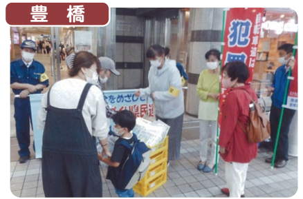
豊橋 豊橋市防犯協会連合会では、安全なまちづくり県民運動の一貫として豊橋駅通路で防犯グッズ、うちわを自由に持ち帰っていただく方法で配布を行いました。