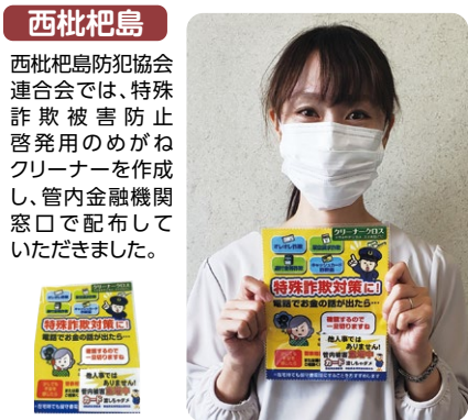
西枇杷島 西枇杷島防犯協会連合会では、特殊詐欺被害防止啓発用のめがねクリーナーを作成し、管内金融機関窓口で配布していただきました。